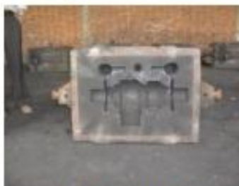
Medio molde de arena