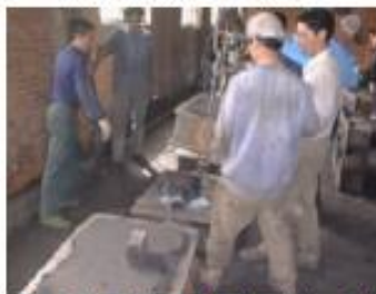
Ensamblando las mitades del molde