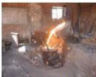
Vaciando acero fundido