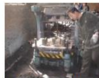
Medio molde con corazón en su lugar