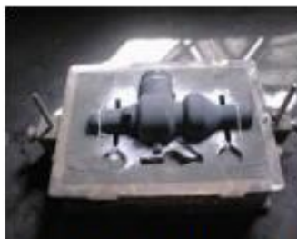
Corazón de arena en medio molde