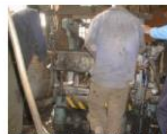
Cerniendo y Comprimiendo Arena