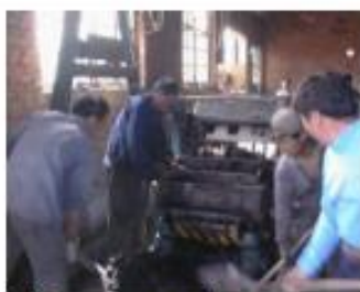
Llenando un molde con arena