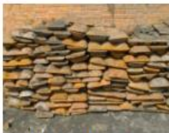
Lingotes de hierro dúctil

Se fabrica una amplia variedad de tipos de vaciado. Abajo se muestra una fábrica que produce vaciados en molde de arena maquinados hechos de hierro dúctil.